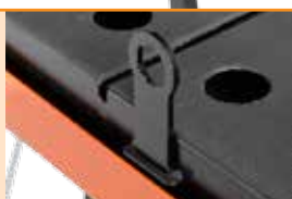
Система остановки конвейерного (роликового) стола