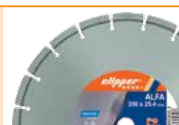
Машина поставляется с диском ClipperALFA Ø350 мм