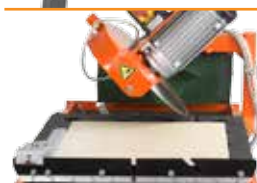
Наклонная головка и широкая 600 мм конвейерная тележка

Новый CM 351 – это легкий камнерезный станок с широкой конвейерной тележкой и поворачивающейся на 45° поворотной головкой для точной резки под углом.