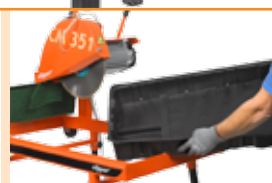
Съемный лоток для воды