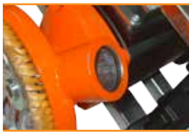
Соединитель для пылесоса